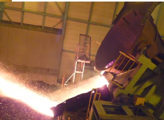
酸化スラグの風砕工程